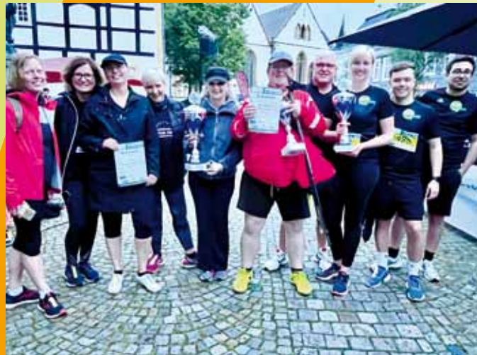
Siegerpokale 2022 für die schnellsten Frauen und Männer.